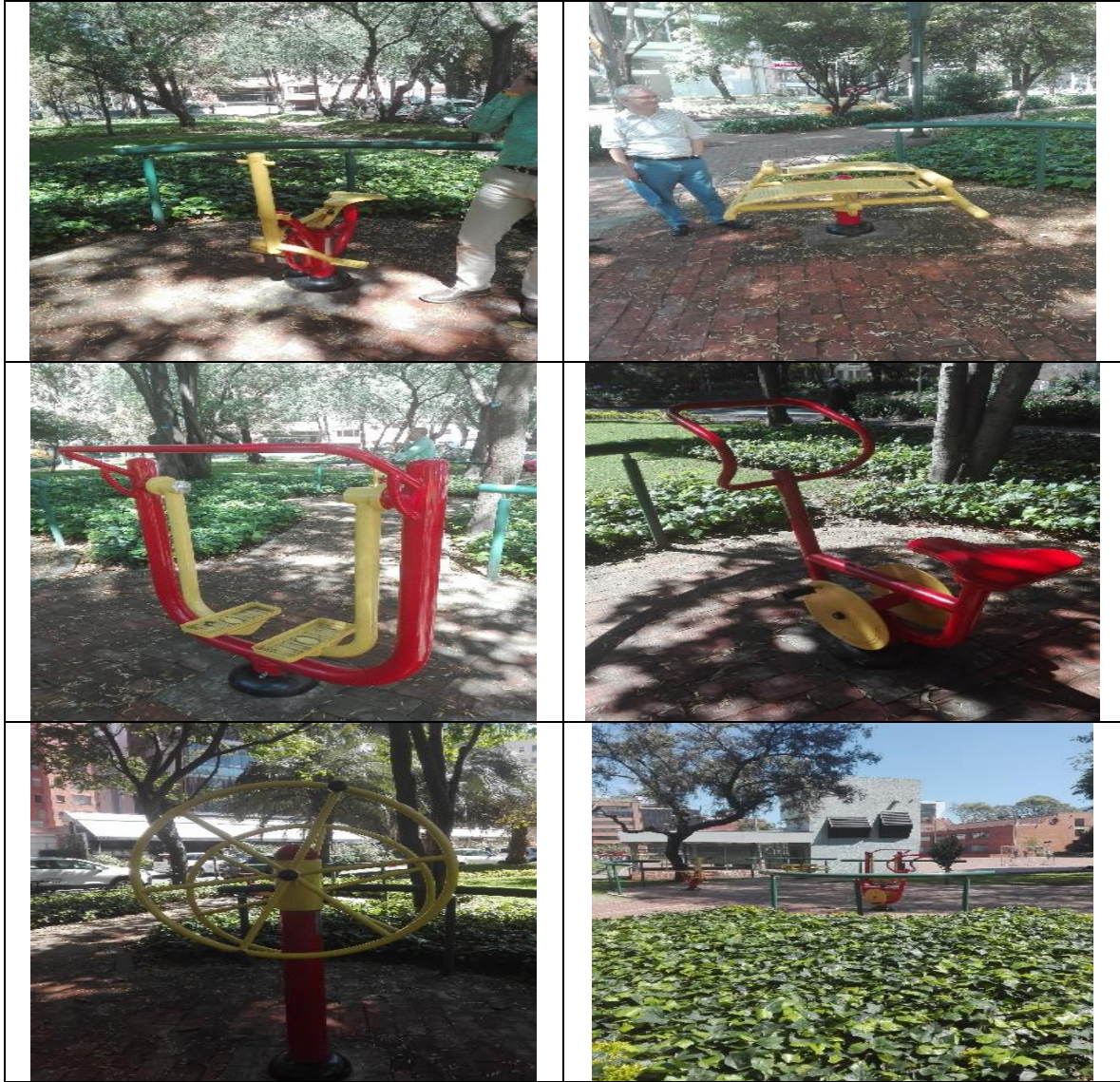
PARQUE AUTOPISTA LAGO CHAPINERO - COD. 02-047 Carrera 16 A N° 78-50